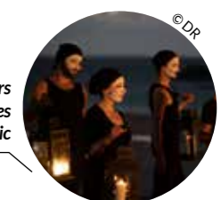
Les Allumeurs de réverbères Artimon - Locmiquélic

Salle de spectacle pluridisciplinaire gérée par la Mairie, avec une programmation associative et professionnelle (5 à 8 spectacles par an). Artimon accueille Blues en Rade, le festival Beltan et des artistes en résidence dont Les Allumeurs de réverbères (voir ci-dessous). 220 places www.ville-locmiquefic.fr