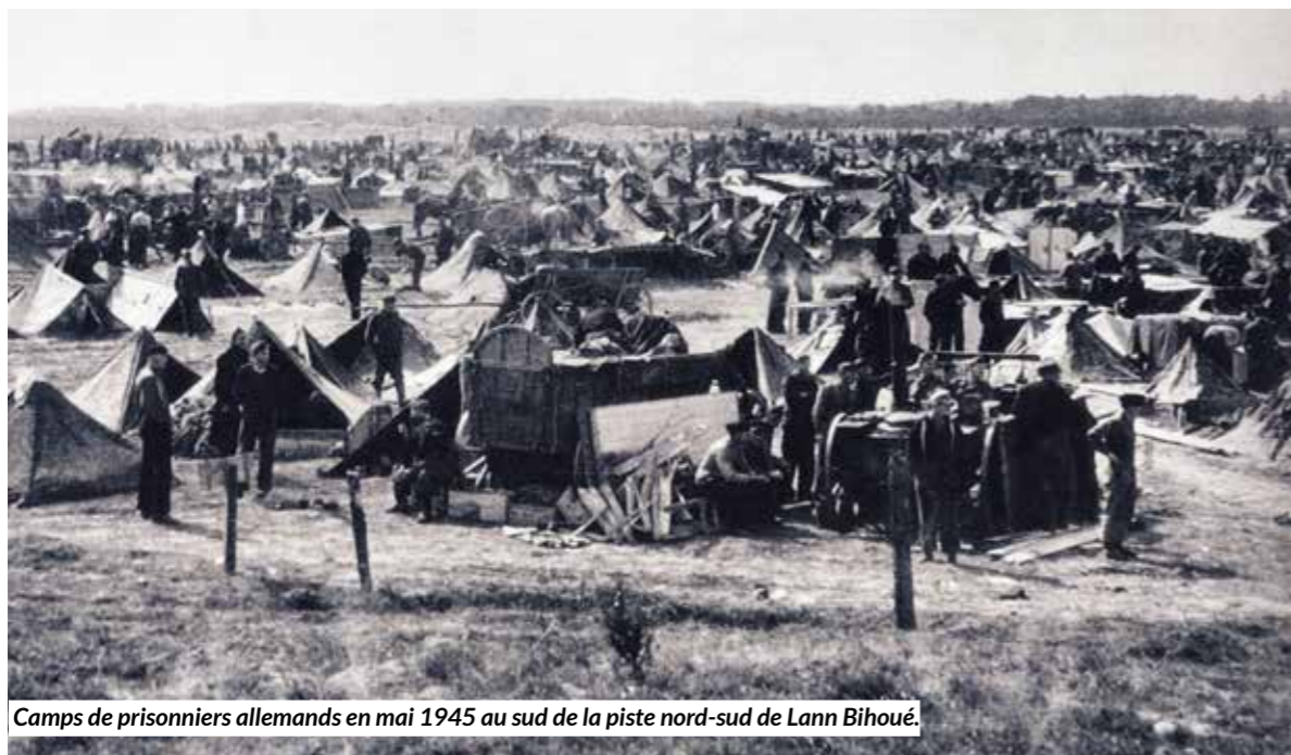
Camps de prisonniers allemands en mai 1945 au sud de la piste nord-sud de Lann Bihoué.

Durant la Seconde Guerre mondiale, les Allemands feront de l'embryon de Lann-Bihoué la plus grande base aérienne d'Europe.