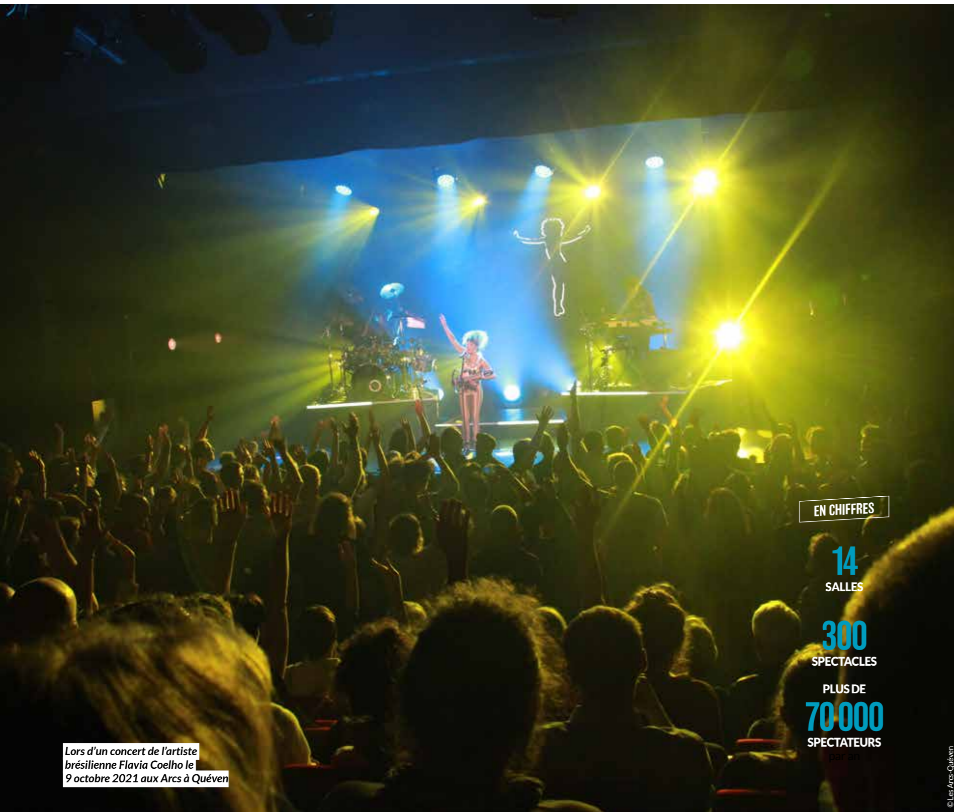
Lors d'un concert de l'artiste brésilienne Flavia Coelho le 9 octobre 2021 aux Arcs à Quéven