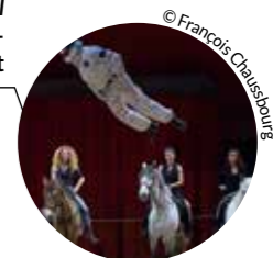
L'Autre Cheval Haras National - Hennebont

Lieu de travail de la compagnie Bouffou Théâtre depuis 2003, le lieu ouvre rapidement ses portes à d'autres compagnies et propose une saison de représentations. Le Théâtre à la Coque a été labellisé par le ministère de la Culture « Centre National de la Marionnette ». 100 places www.theatrealacoque.fr