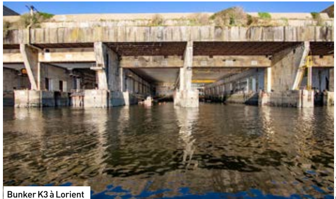
Bunker K3 à Lorient