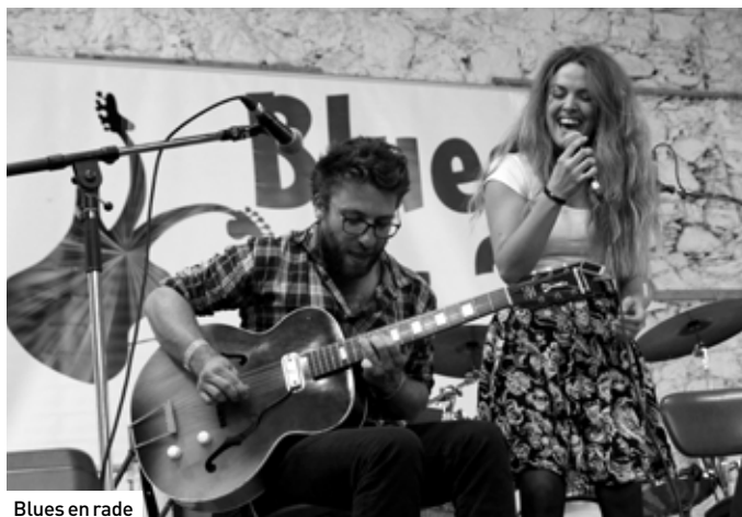
Blues en rade