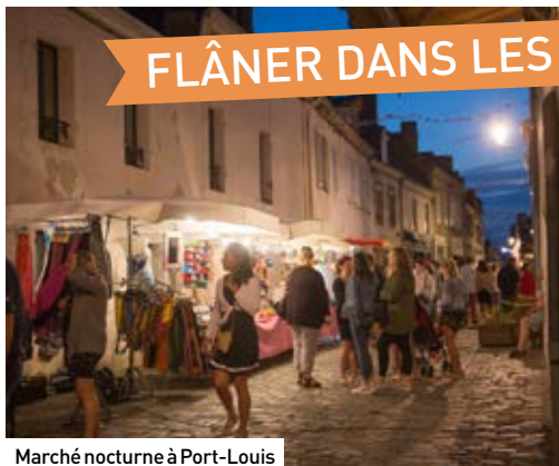
Marché nocturne à Port-Louis