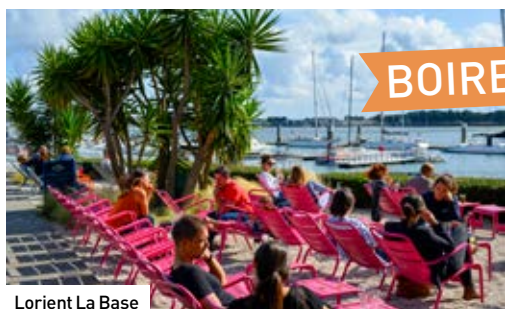
Lorient La Base