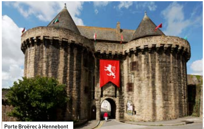
Porte Broërec à Hennebont