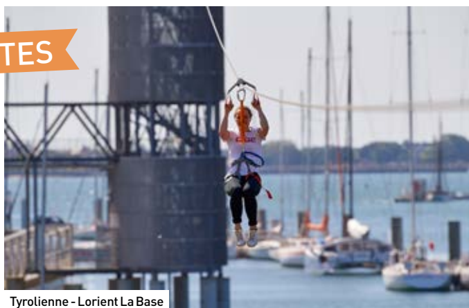
Tyrolienne - Lorient La Base