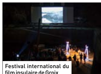
Festival international du film insulaire de Groix