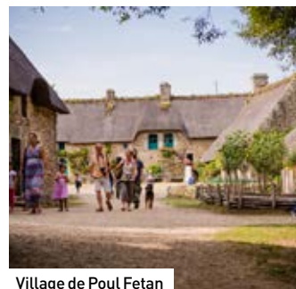
Village de Poul Fetan