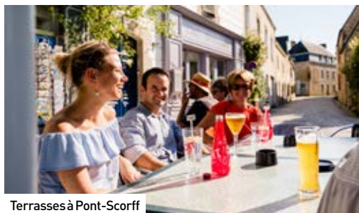
Terrasses à Pont-Scorff