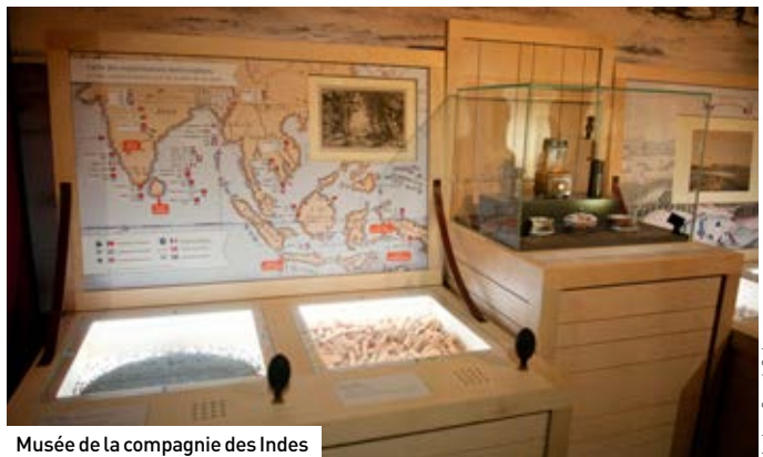
Musée de la compagnie des Indes