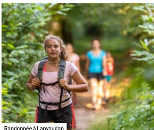
Randonnée à Lanvaudan