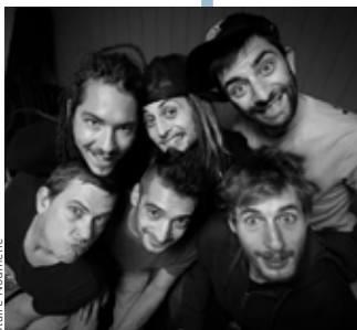
La P'tite Fumée

Festival Insolent, collection automne 2020 - Sam. 24 octobre - Parc des expositions de Lanester - Infos et réservations : www.festival-insolent.com