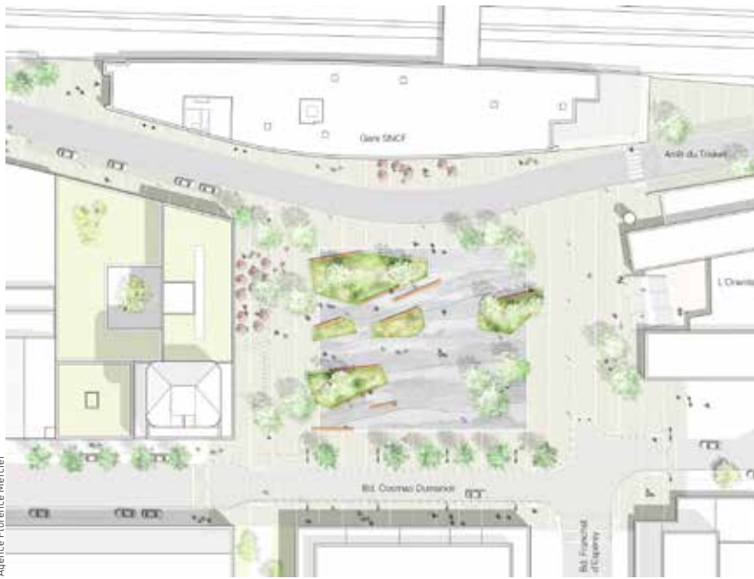
Le plan masse du futur parvis de la gare

S a façade habillée de béton fibré et de verre commence à apparaître : la nouvelle gare entre en scène. Jusqu'à présent cachée derrière les immeubles de la Poste et des Impôts, sa silhouette se dessine au fur et à mesure des coups de pelleuses portés sur les bâtiments en cours de déconstruction. C'est le dernier grand chapitre des travaux de la nouvelle gare qui s'ouvre, dévoilant l'orientation plein sud du bâtiment voyageurs, et laissant deviner le futur et vaste parvis de la gare, dans l'axe du boulevard Franchet-d'Esperey et de l'actuelle place François-Mitterrand. Si les travaux de la nouvelle gare sont déjà bien avancés, cette opération de démolition marque