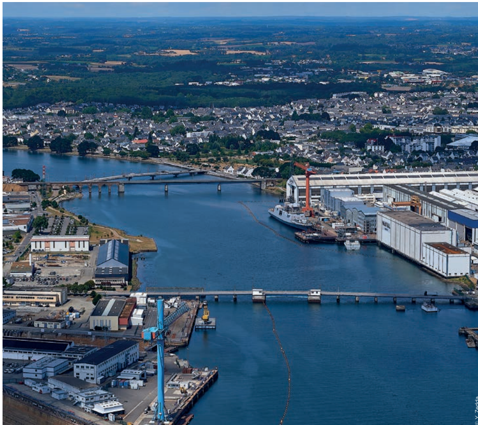
Les premiers dragages auront lieu sur le site de Naval Group afin d'assurer une profondeur d'eau suffisante pour les frégates.

Sur dix ans, 1,4 millions de mètres cubes de sédiments doivent être retirés des fonds marins afin d'assurer une profondeur suffisante pour les activités liées à la mer.