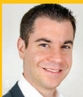
SYLVAIN LE GUEN, agence Be Attractive*

« L'APPLI, C'EST LE TERRITOIRE AU CREUX DE LA MAIN »