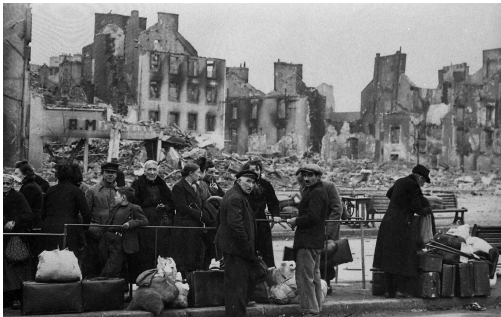
Lorient pendant la guerre : évacuation des Lorientais. Ils attendent le car à la gare routière (1943)

Site du commandement stratégique de la Bataille de l'Atlantique, Lorient et sa base de sous-marins sont la cible d'intenses bombardements pendant la guerre. La forteresse de béton résiste et les troupes allemandes s'y replient pour former la Poche de Lorient, face à la progression des Alliés débarqués en 1944. Il faudra près d'un an pour libérer Lorient, presque entièrement détruite et défigurée par les blockhaus édifiés par les Allemands. De baraques en reconstructions, de reconversions en développement, Lorient célèbre aujourd'hui son histoire et sa résilience.