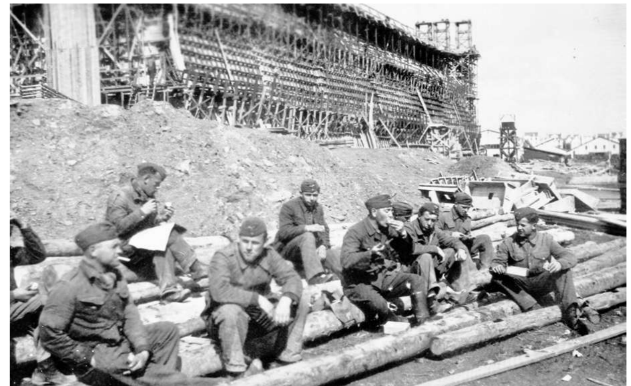
Construction d'un dombunker du slipway du port de pêche

Comment restituer aujourd'hui la réalité de cette Poche de Lorient ? Si les bunkers de la base des sous-marins ont été préservés, nombre des 500 ouvrages défensifs disséminés sur le territoire ont été détruits. Ils font pourtant partie de l'histoire du territoire et de sa population : c'est à présent une deuxième étape de patrimonialisation de ces traces intangibles de la Seconde Guerre mondiale qui s'ouvre. L'autre enjeu est aussi de faire comprendre la poche et le paysage militairement colonisé aux jeunes générations. »