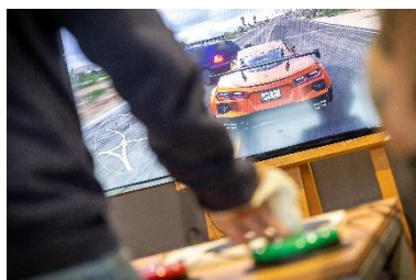
Cr dit photo :   Lorient Agglo/N. Saint-Maur

Le public sera invit    participer   une comp tition e-sport inclusive sur le jeu Forza.