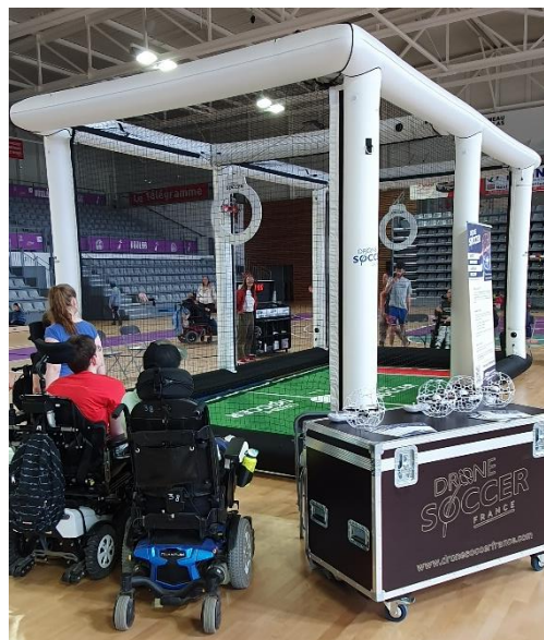
Cr dit photo :   Faireplay

Nouvelle discipline techno-sportive, il s'agit de combiner la ma trise du pilotage de drones avec l'esprit d' quipe et la strat gie du football traditionnel. Les joueurs contr lent des drones sph riques dans un espace a rien d limit , cherchant   marquer des points en guidant leur drone   travers des cibles. Con u pour  tre accessible   tous, ce sport permet aux personnes en situation de handicap de participer pleinement et de d montrer leurs comp tences en la mati re.