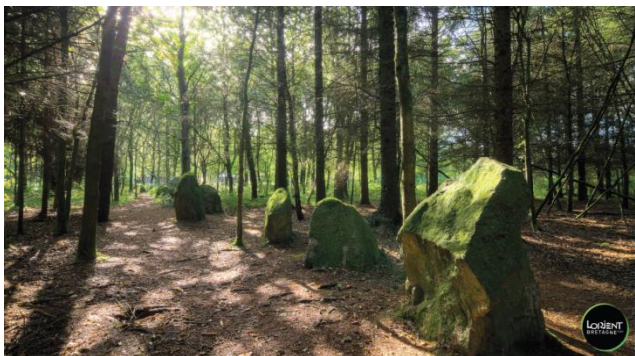
Alignements de Kersolan à Languidic

Ce parcours photographique va permettre aux voyageurs de découvrir notamment la citadelle de Port-Louis, la Cour des métiers d'art à Pont-Scorff, les alignements des menhirs de Kersolan à Languidic, le port de pêche de Lorient-Keroman, le pôle course au large de Lorient La Base, la crique de Poulziorec à Groix ou encore le village de Poul-Fetan à Quistinic... Sur chaque visuel est détaillé le lieu de la prise de vue et son auteur.