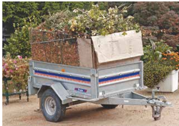
Réduire la production de déchets verts et les utiliser pour pailler votre jardin ou fabriquer du compost vous évite des déplacements en déchèterie.

en jouant sur des techniques de jardinage : moins d'engrais et d'arrosages pour limiter la croissance des plantes ; tontes, feuilles et brindilles laissées sur place ; diminution du nombre de tontes (mise en place de prairies fleuries, tontes sur certaines zones du jardin seulement...).