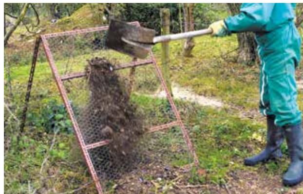
Pour tamiser, un simple grillage posé sur un cadre peut faire l'affaire.

Le tamisage permet d' affiner le compost et de l'utiliser plus facilement . Il permet d'éliminer les éléments grossiers qui n'ont pas été complètement transformés.