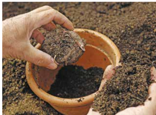
Le compost doit être mélangé avec de la terre quand il est utilisé en support de culture.

Pour la création de nouvelles jardinières, un bon mélange est constitué d' un tiers de compost, un tiers de terre et un tiers de sable . Si vous réutilisez des jardinières de l'année précédente, vous rajouterez 20 % maximum de compost à la quantité de l'ancienne terre. Vous pouvez aussi l'utiliser pour vos plantes d'intérieur de la même façon.