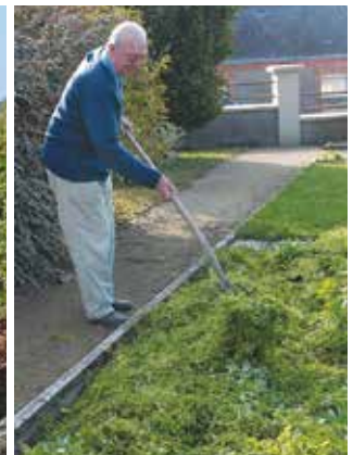
Il est possible de pailler avec des feuilles mortes ou des herbes fraîches.