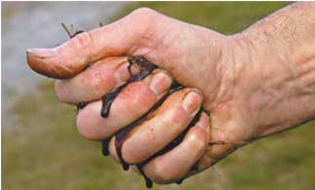
Le compost doit être humide (comme une éponge pressée) mais sans excès. Si du liquide sort d'une poignée de compost pressée, il est trop humide.

Trop d'humidité empêche l'aération : le compostage est freiné et des odeurs désagréables se dégagent. Si c'est le cas, on peut étaler le compost quelques heures au soleil ou le mélanger avec du compost sec ou de la terre sèche. Pas assez d'humidité : les déchets deviennent secs, les micro-organismes meurent et le processus s'arrête. Il faut alors arroser le compost.