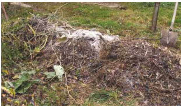
Le compostage en tas est pratique si vous disposez de place mais de peu de temps à y consacrer.