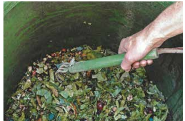
Le brassage des déchets est une des conditions de la réussite d'un compost.

réaliser un brassage régulier (notamment au début du compostage lorsque l'activité des micro-organismes est la plus forte, puis tous les 1 à 2 mois). Le brassage permet de décompacter le compost, de l'aérer et d'assurer une transformation régulière .