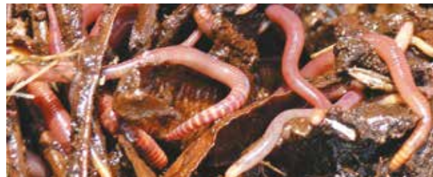
Des vers de fumier, cheville ouvrière du lombricompostage.

Attention, les lombrics provenant de la terre d'un jardin ne conviennent pas pour le lombricompostage.