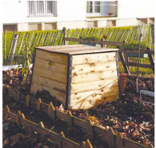
La pratique du compostage partagé se développe de plus en plus.

Dans votre immeuble, votre résidence ou votre quartier; parlez-en autour de vous pour savoir si des habitants voudraient participer; mobilisez vos voisins, c'est un des gages de réussite d'une telle opération.